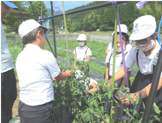
↑ 作物の世話をする5年生

県北市町村の多くの学校では、休校措置がとられ、学習面・生活面・精神面でも不安な1学期を過ごしたようですが、東栗倉の子どもたちは、元気にそして落ち着いて学習にも取り組み、充実した1学期を送ることができたと思います。