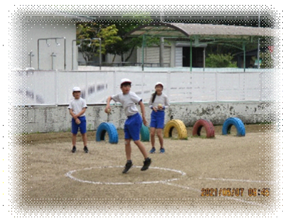
▲ソフトボール投げ

交通安全教室では、自転車の準備を下された保護者の皆様に感謝申し上げます。ありがとうございました。